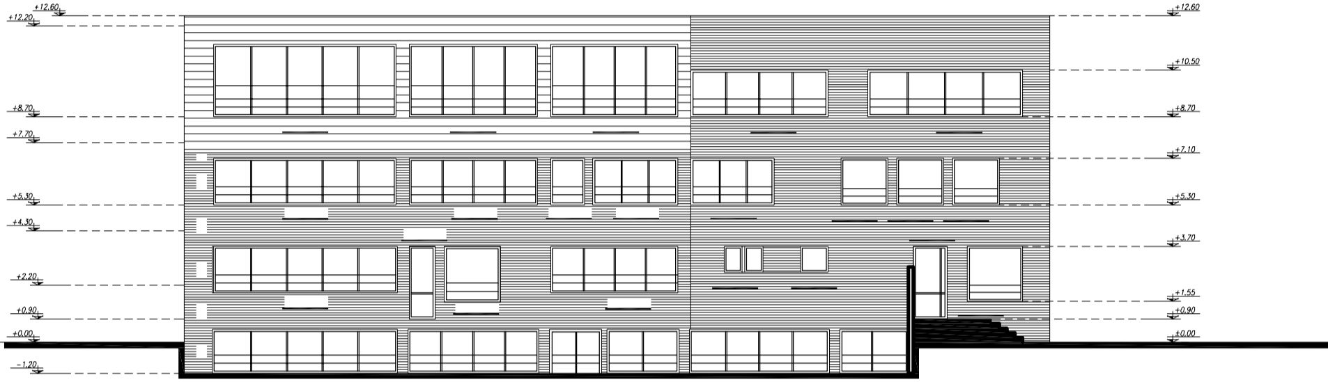
NORTH ELEVATION SC: 1/200