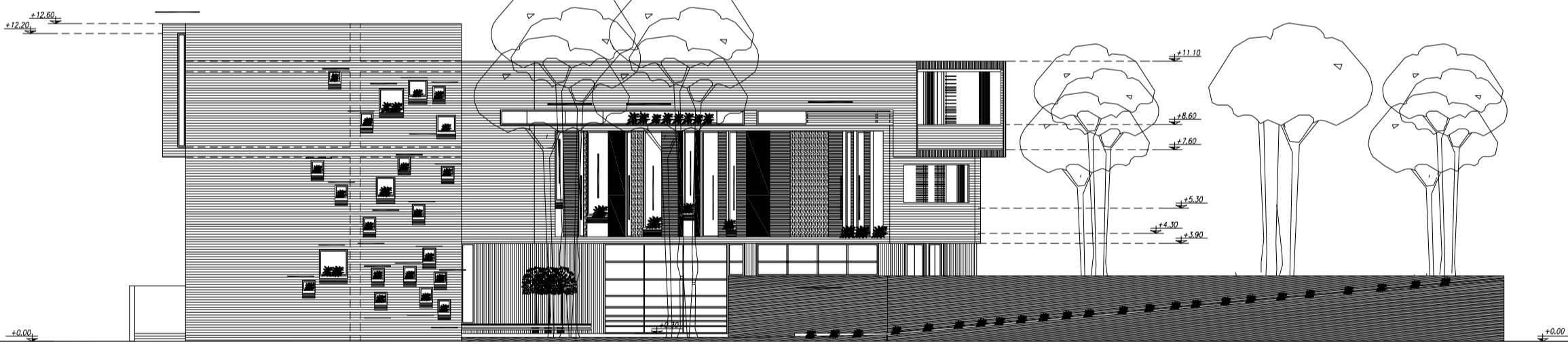
WEST ELEVATION SC: 1/200